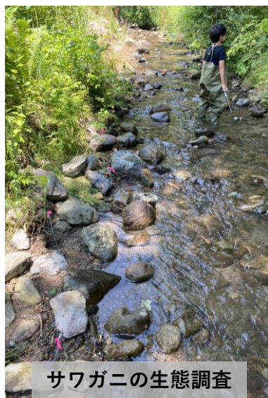
サワガニの生態調査