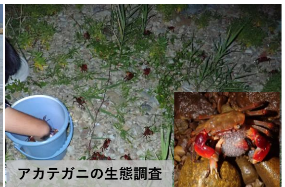
アカテガニの生態調査