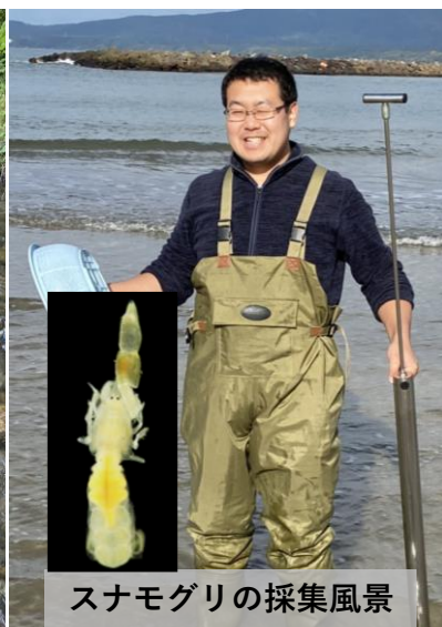
スナモグリの採集風景