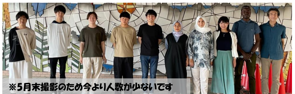
※5月末撮影のため今より人数が少ないです