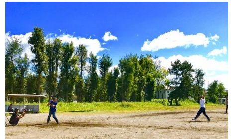
ソフトボールではガチです。