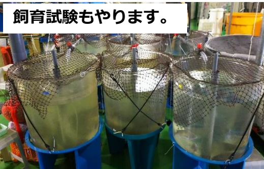
飼育試験もやります。