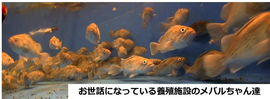
お世話になっている養殖施設のメバルちゃん達